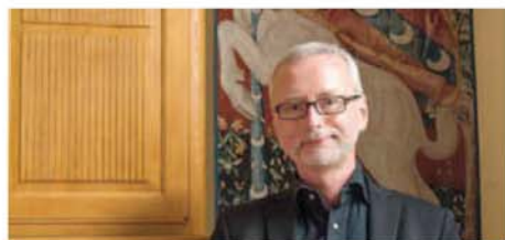
Dick Harrison, professor, författare.