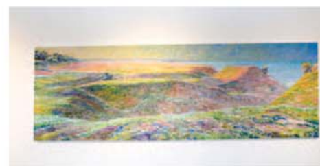
En panoramavy över Ramlundas blommande backar.

På impressionistiska målningar fångas i olja och ljus hur landskapet böljar mjukt kring Ramlunda. Och för att fånga alla skuggor och "allt som händer med ljuset" fick det bli på avlänga, panoramaliknande dukar.